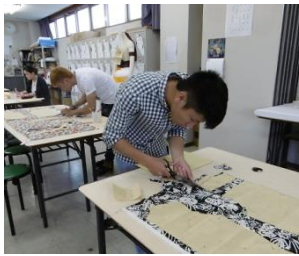
ファッションデザイン