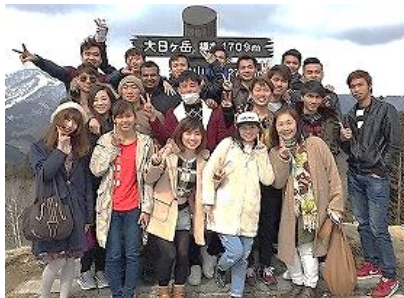
レクリエーション